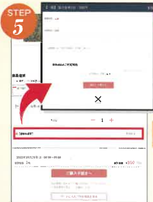
日付、時間、枚数を選択後は、都道府県、乗車人数を必ず入力してください