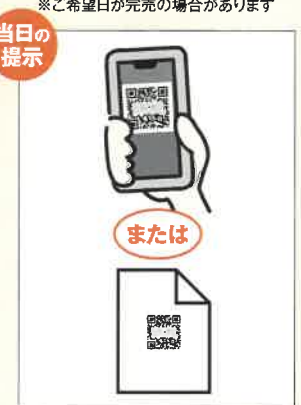
ご来場の際は、電子チケット(二次元コード)または印刷したものを提示ください

●キャンセル料は次のとおりです。予約日の3日前まで:0%、2日前~前日:50%、当日:100% ●お電話でのご予約は受け付けておりません。 ●予約に空きが無い場合もございます。●インターネット予約・購入は当日でも可能です。●合計金額が1250円以下の場合にはコンビニ決済をご利用いただけません