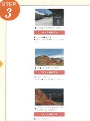
目的に合わせて、選択してください