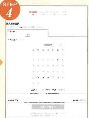
ご希望の日付、時間、枚数を選択してください ※ご希望日が完売の場合があります