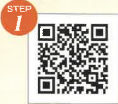
上記サイトにアクセス

※退場後の再入場は不可となります。※入場時は以下の方法でチケットをご準備ください。