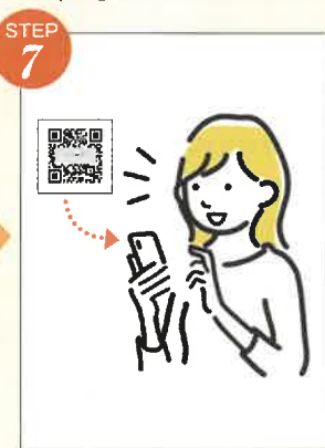
決済手続きが完了したら、ご登録メールアドレスに電子チケット(二次元コード)が送付されます