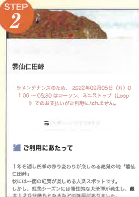
雲仙仁田峠のページへ